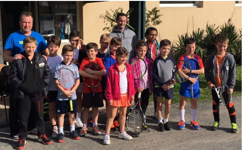
Rassemblement bi-départemental 16/79 15 enfants présents dont 6 jeunes du 79 Merci à la Charente pour leur accueil